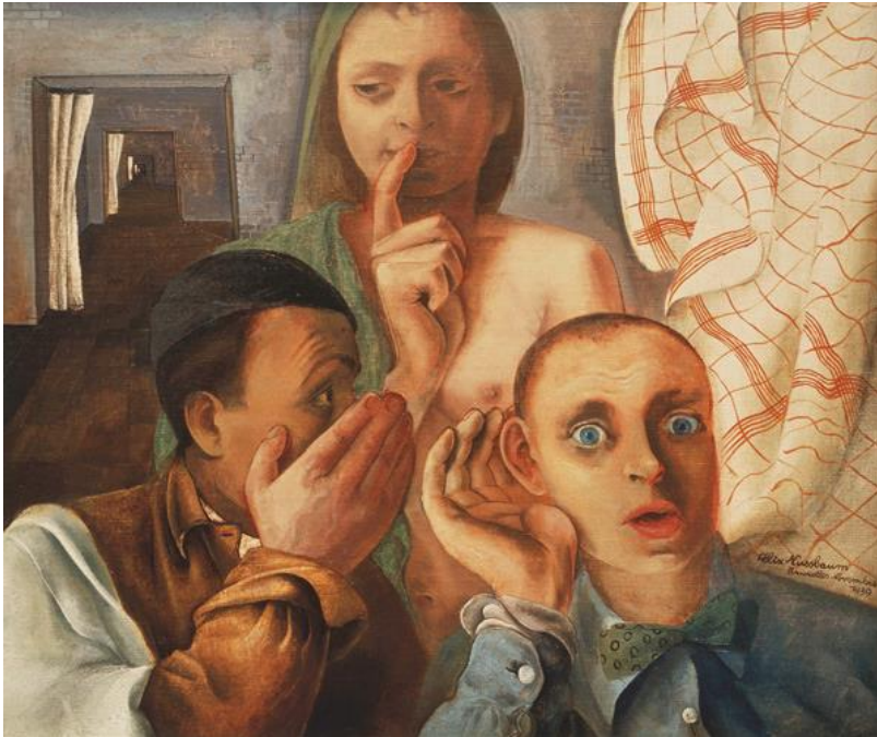
Felix Nussbaum. Das Geheimnis. 1939. Öl auf Leinwand.

48. Jahrestagung Das Geheimnis 29. – 31.10.2015 Würzburg