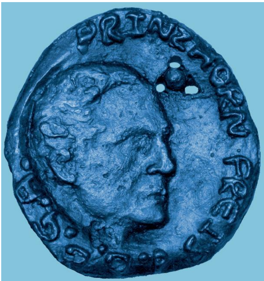
Hans Prinzhorn-Medaille (Anonymus)

50. Jahrestagung Impuls Prinzhorn 26. – 28.10.2017 Heidelberg